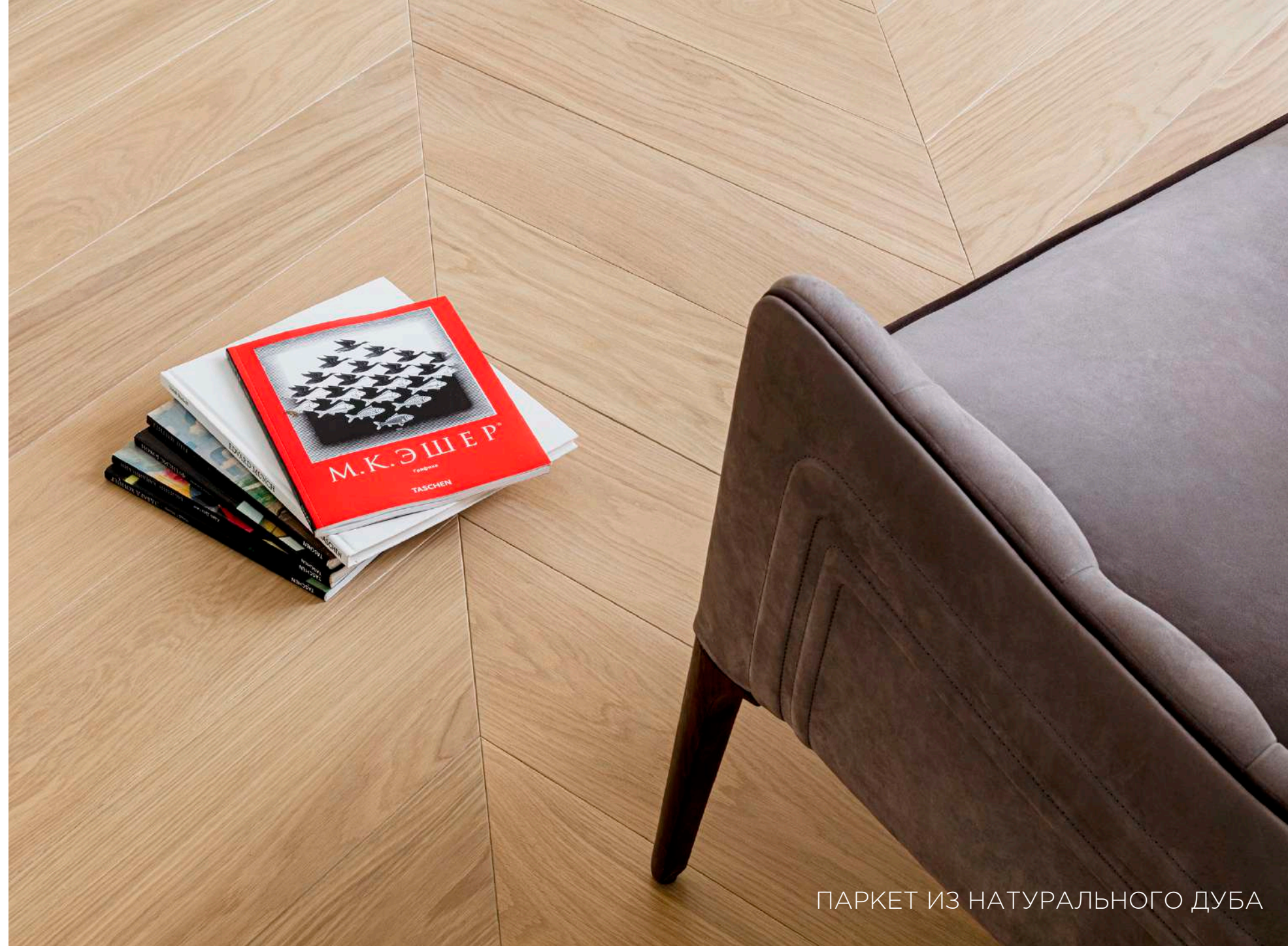
ПАРКЕТ ИЗ НАТУРАЛЬНОГО ДУБА

Все квартиры предлагаются с отделкой натуральными материалами, оборудованными кухнями и ванными комнатами.