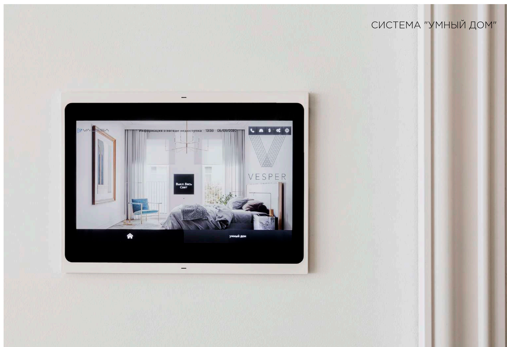
СИСТЕМА "УМНЫЙ ДОМ"

Благодаря инновационной системе контроля качества воздуха, очищающей его по медицинским стандартам от всех мельчайших видов загрязнений, пространства проекта Cloud Nine наполняет чистейший воздух, сравнимый по качественным характеристикам с горным,